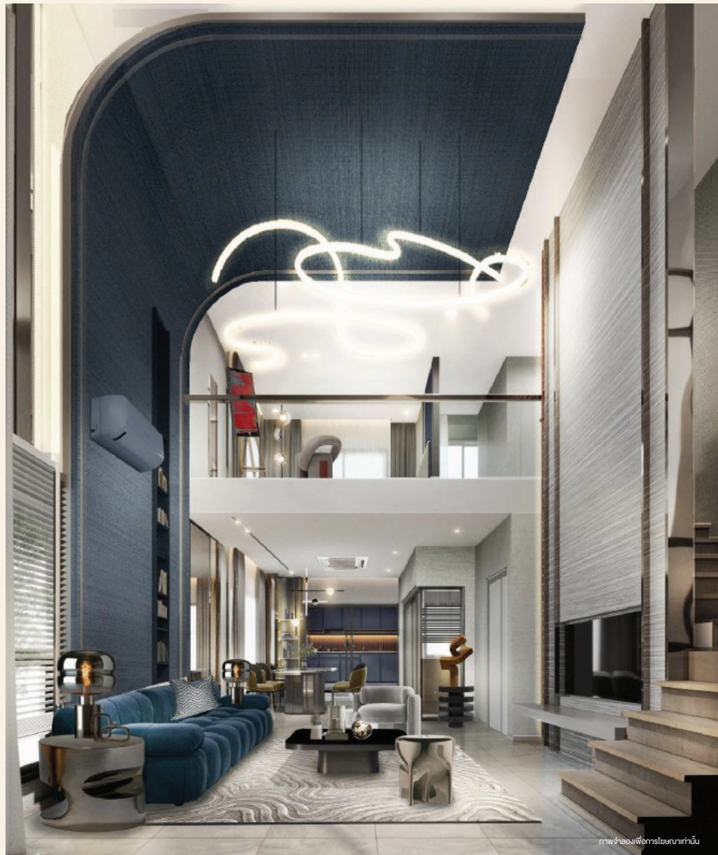
ภาพจำลองเพื่อการโฆษณาเท่านั้น