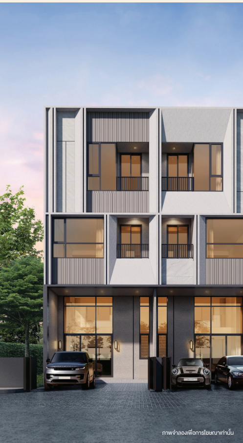
ภาพจำลองเพื่อการโฆษณาเท่านั้น