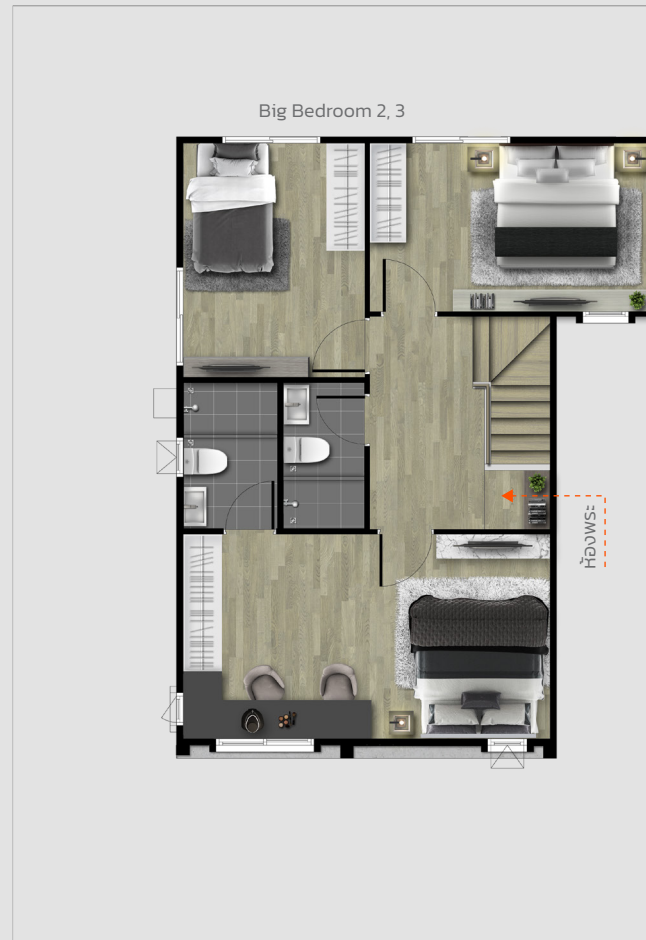
2nd FLOOR PLAN

3 ห้องนอน | 3 ห้องน้ำ ห้องนอนยกประสูงค้ | ห้องรับแขก | พื้นที่รับประทานอาหาร ห้องครัวฝรั่ง | ห้องครัวไทย | ลานซักล้าง | 2 ที่จอดรถ