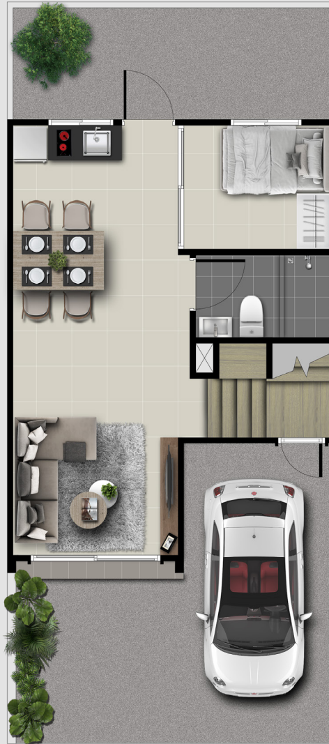
1st FLOOR PLAN

108 SQ.M. พื้นที่ดินเริ่มต้น 17.4 ตร.ว. 3 BEDROOMS 2 BATHROOMS