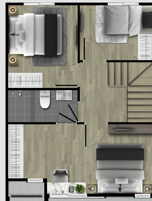
2nd FLOOR PLAN

112 SQ.M. พื้นที่ดินเริ่มต้น 18 ตร.ว. 3 BEDROOMS 2 BATHROOMS