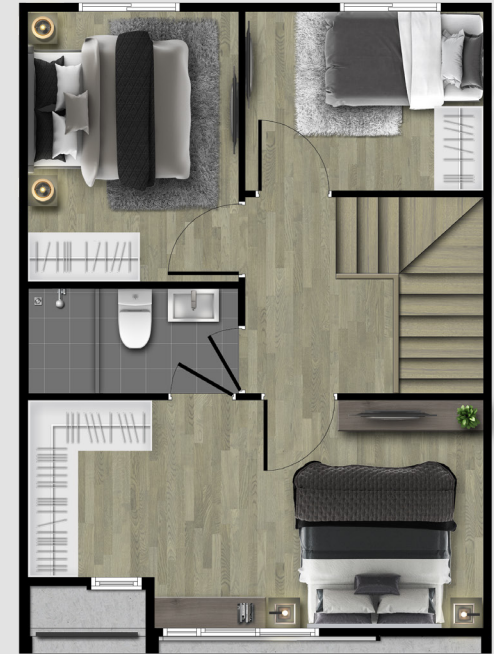
2nd FLOOR PLAN

3 ห้องนอน | 2 ห้องน้ำ ห้องอเนกประสงค์ | ห้องรับแขก | ห้องเก็บของ ห้องครัว | พื้นที่รับประทานอาหาร ลานซักล้าง | 1 ที่จอดรถ