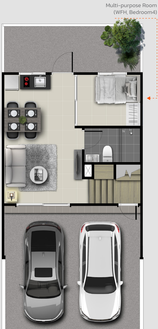
1st FLOOR PLAN

112 SQ.M. พื้นที่ดินเริ่มต้น 18 ตร.ว. 3 BEDROOMS 2 BATHROOMS