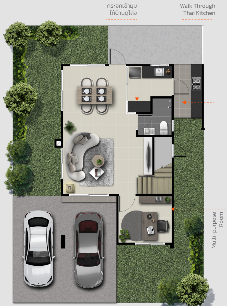
1st FLOOR PLAN