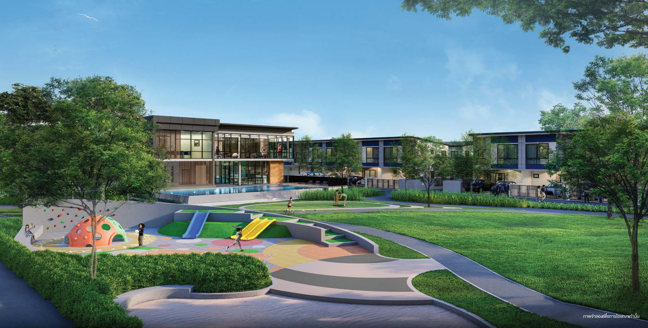
ภาพจำลองเพื่อการโฆษณาเท่านั้น