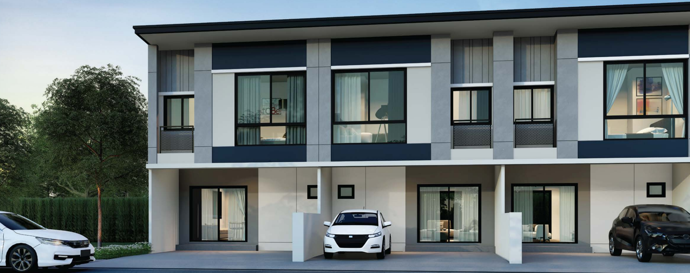
ภาพจำลองเพื่อการโฆษณาเท่านั้น