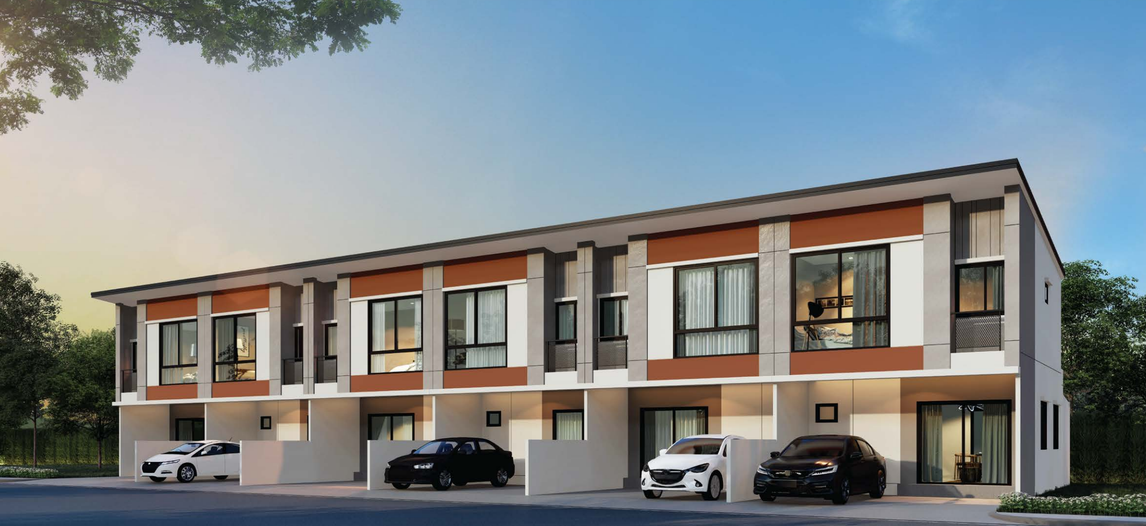
ภาพจำลองเพื่อการโฆษณาเท่านั้น