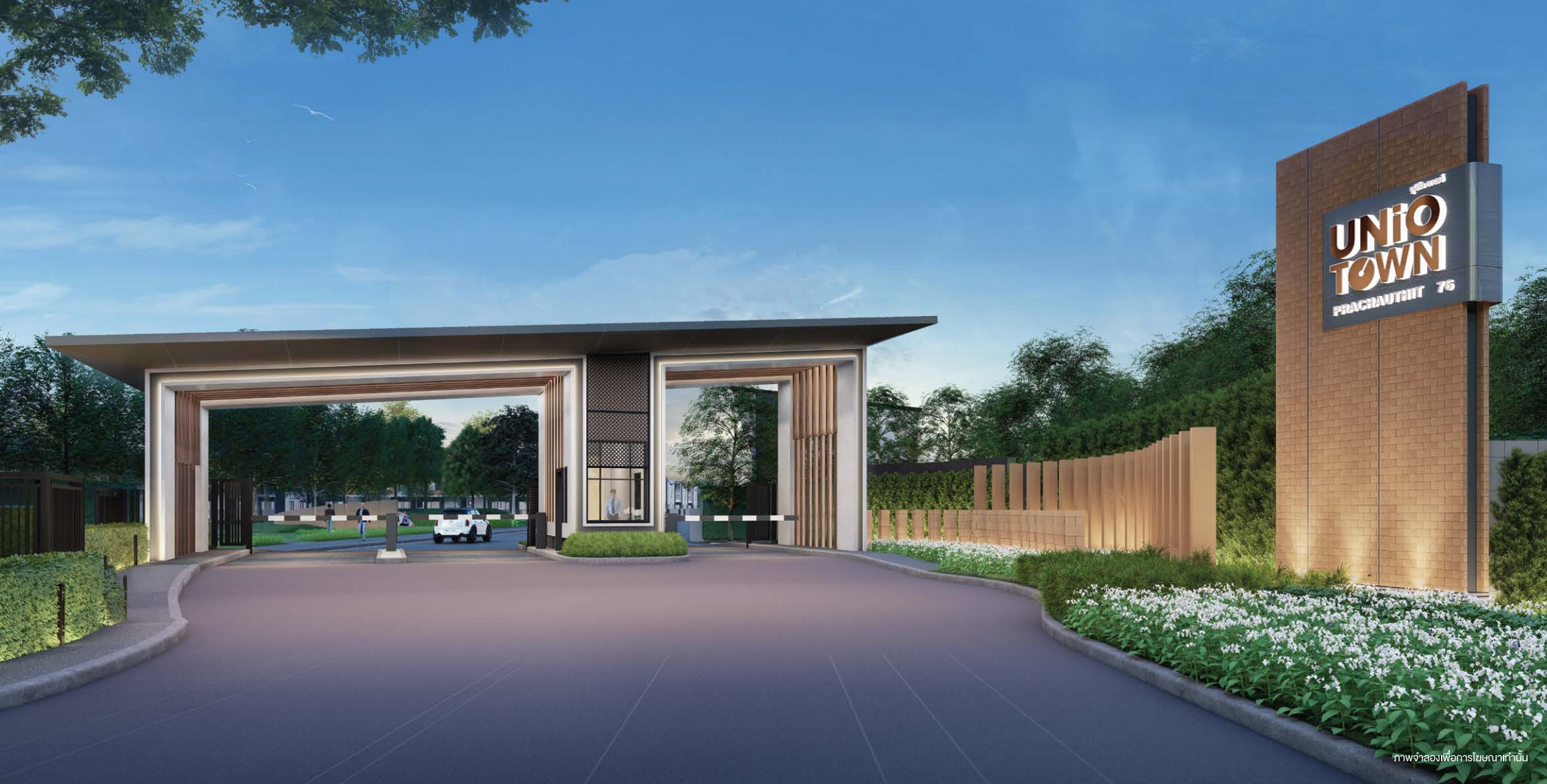
ภาพจำลองเพื่อการโฆษณาเท่านั้น