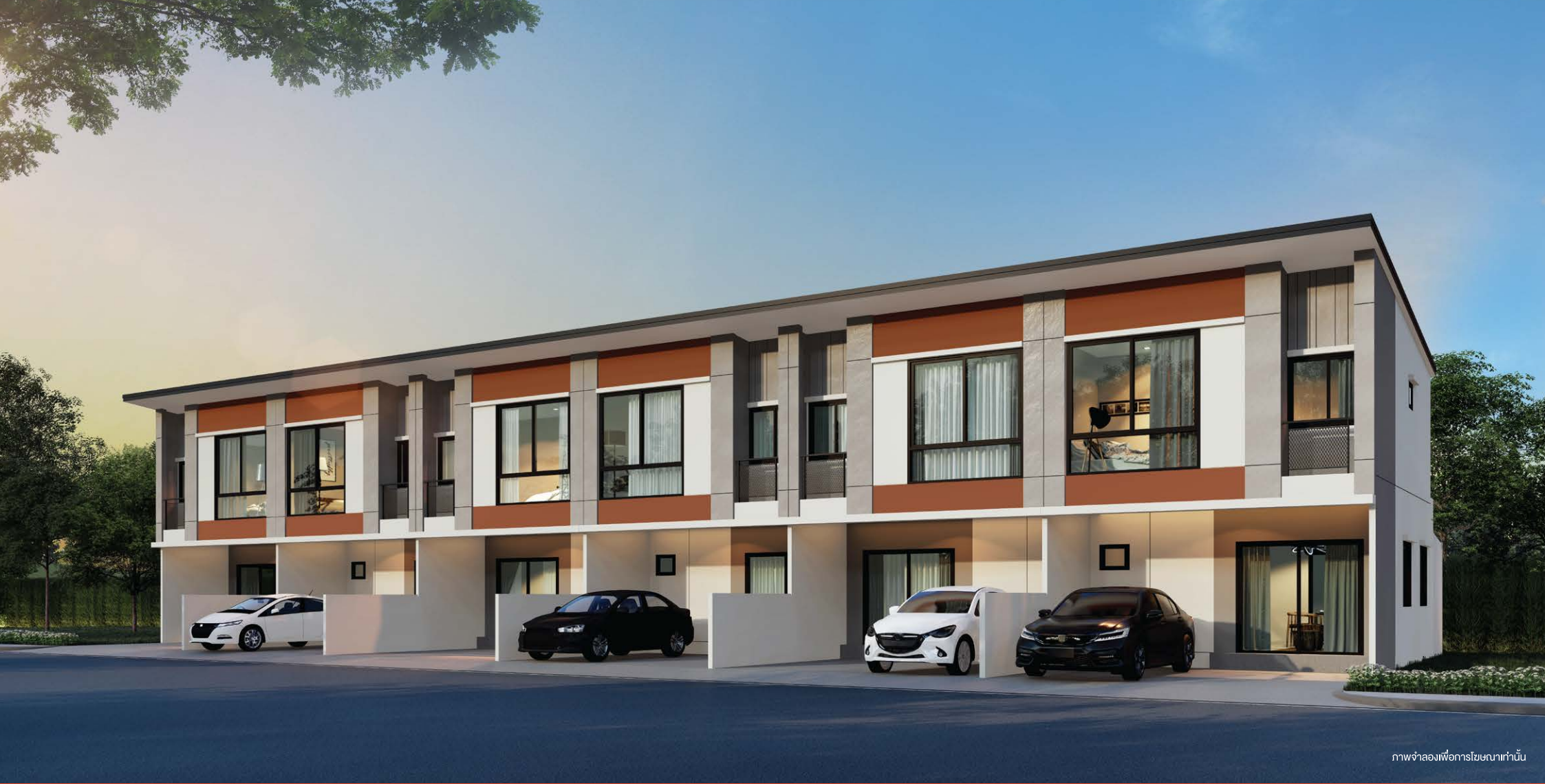
ภาพจำลองเพื่อการโฆษณาเท่านั้น