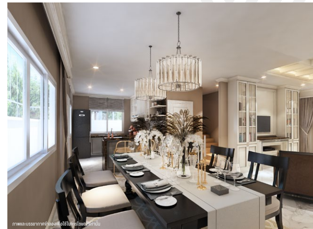
ภาพและบรรยากาศจำลองเพื่อใช้ในการโฆษณาเท่านั้น