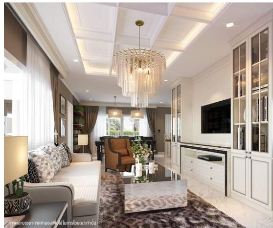
ภาพและบรรยากาศจำลองเพื่อใช้ในการโฆษณาเท่านั้น