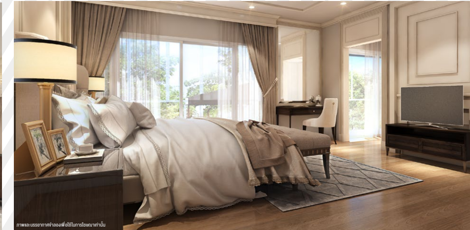
ภาพและบรรยากาศจำลองเพื่อใช้ในการโฆษณาเท่านั้น