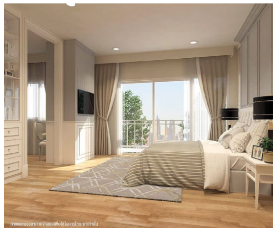
ภาพและบรรยากาศจำลองสิ่งอำนวยความสะดวกภายใน