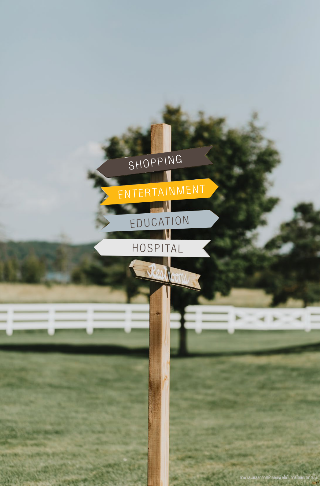
ภาพศิลปะกราฟิกจำลองเพื่อใช้ในการโฆษณาเท่านั้น