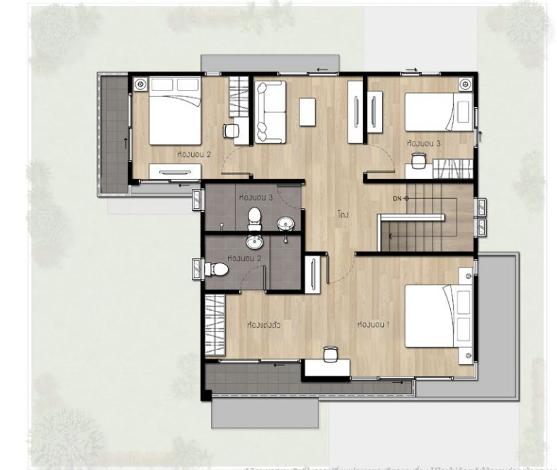
บริษัทฯ ขอสงวนสิทธิ์ในการเปลี่ยนแปลงรายละเอียดตามที่ระบุไว้โดยไม่ได้แจ้งให้ทราบล่วงหน้า และขนาดพื้นที่ระบุไว้เป็นเพียงการประมาณการ ซึ่งรูปแบบการตรวจประเมินโครงสร้างและรายละเอียดอื่น ๆ เป็นเพียงการแสดงผลการตรวจวัดพื้นที่โดยละเอียดเพื่อการโฆษณาเท่านั้น