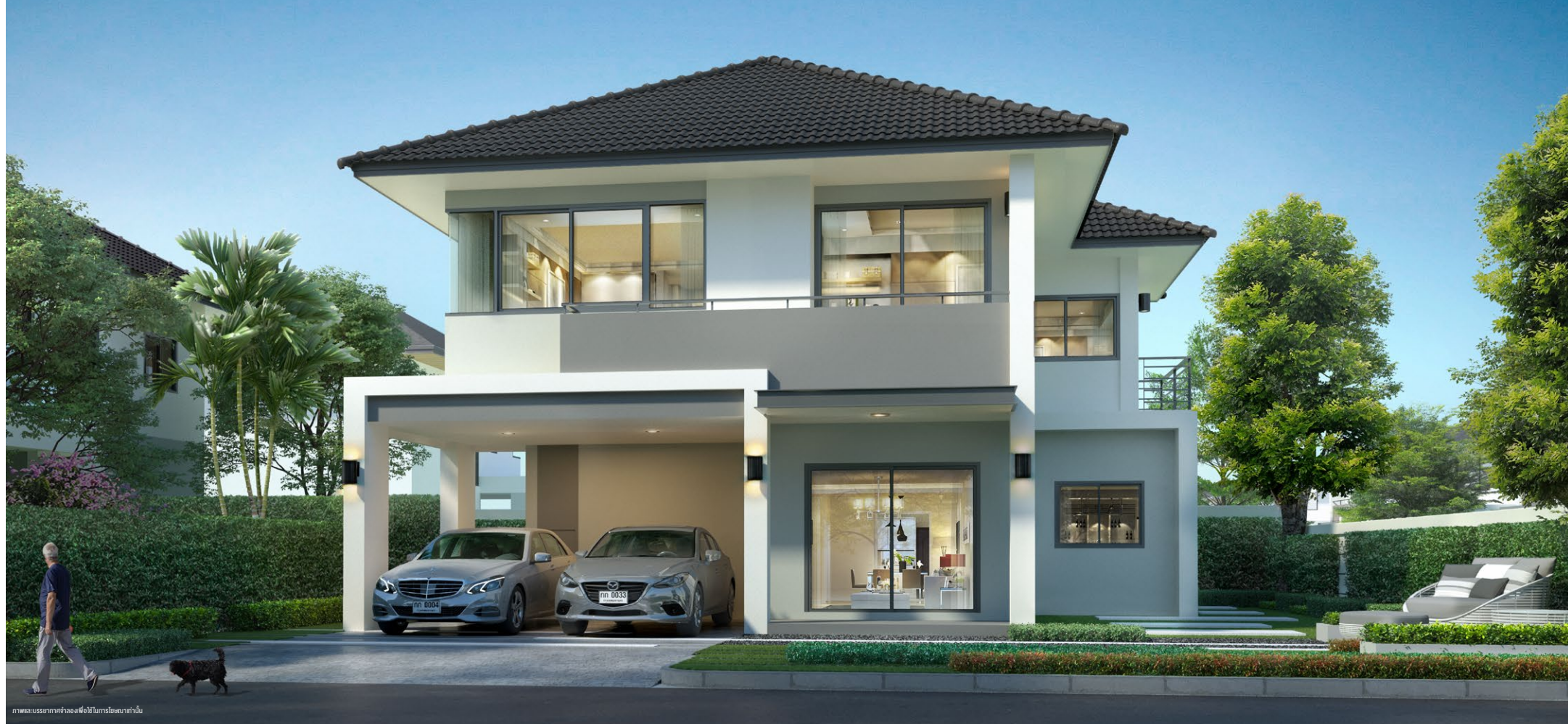
ภาพและบรรยากาศจำลองเพื่อใช้ในการโฆษณาเท่านั้น