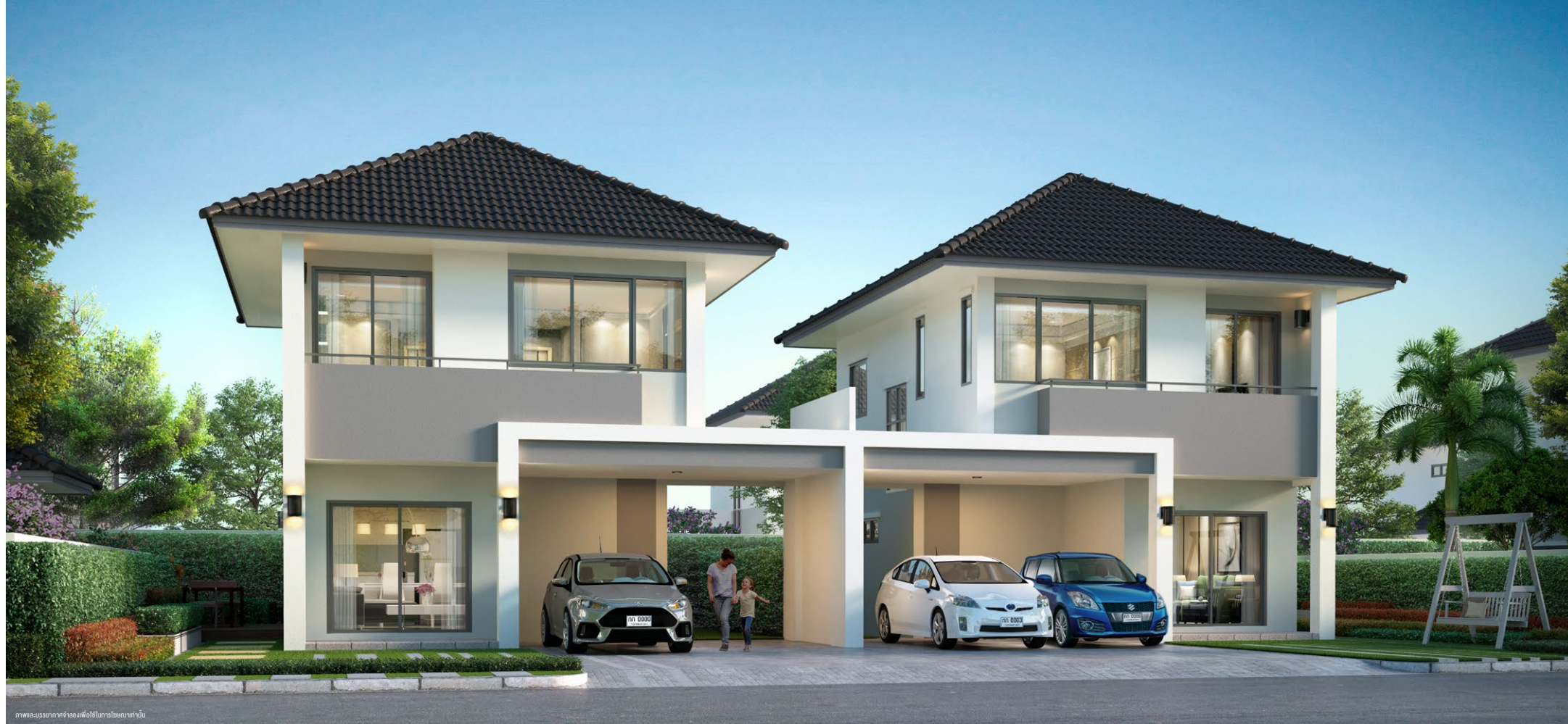
ภาพและบรรยากาศจำลองสิ่งอำนวยความสะดวกภายใน