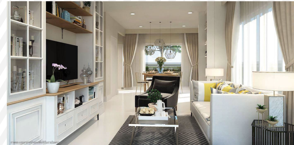
ภาพและบรรยากาศจำลองสิ่งอำนวยความสะดวกภายใน