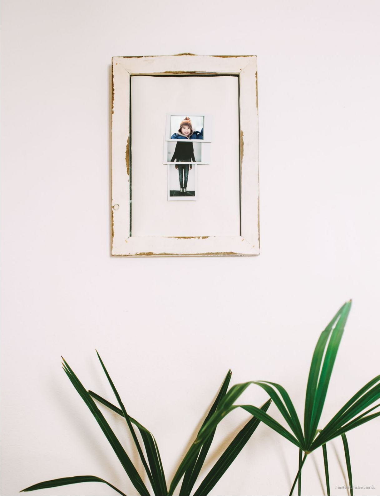
ภาพพิธีเปิดโครงการบ้านกั้น