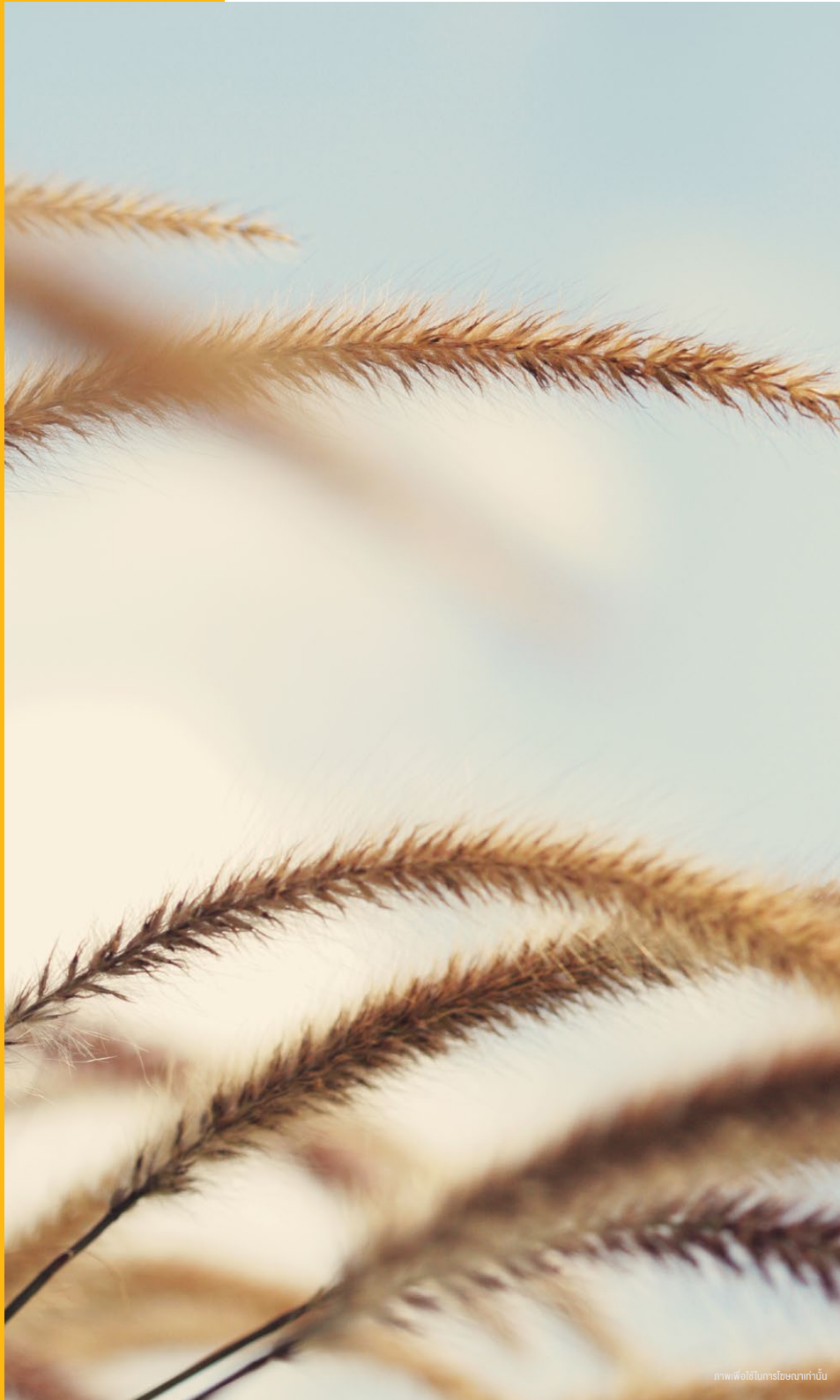
ภาพพิธีเปิดโครงการบ้านกั้น