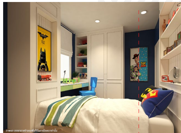
ภาพและบรรยากาศจำลองสิ่งอำนวยความสะดวกภายใน